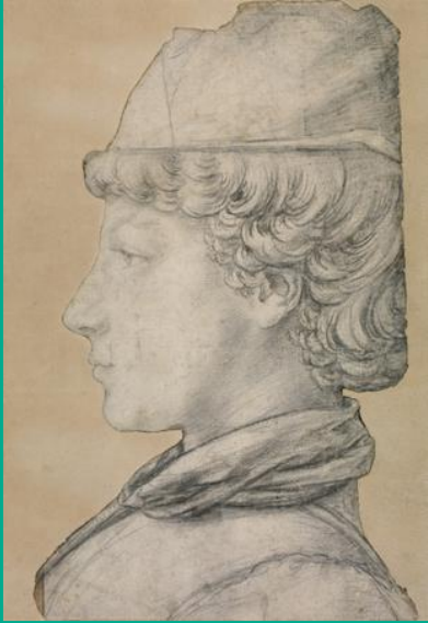
Antonio del Pollaiuolo (1431/32-1498) nó Piero del Pollaiuolo (c.1441-c.1496), "Portráid Próifíl d'Fhear Óg", c.1470-1475.