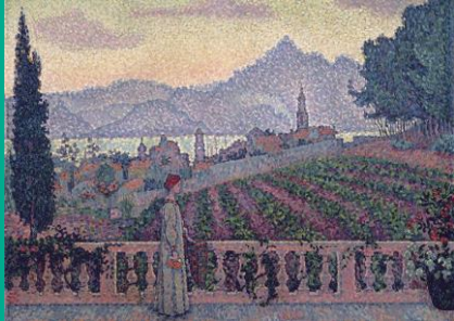
Sonra ó An Ardáin, Saint-Tropez, Paul Signac 1898.