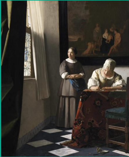
Johannes Vermeer (1632-1675), 'Bean ag Scríobh Litir lena Cailín Aimsire', c.1670.