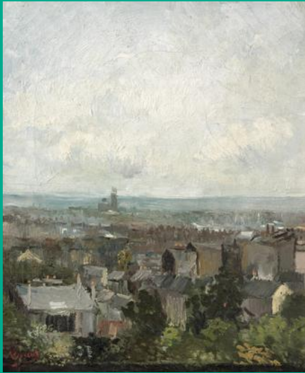
Vincent van Gogh (1853-1890), Dionta i bPáras 1886.