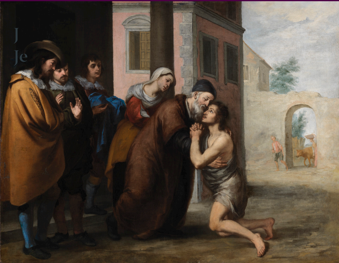
Bartolomé Esteban Murillo (1617-1682), An Mac Drabhlásach ag Teach Ar ais, 1660.